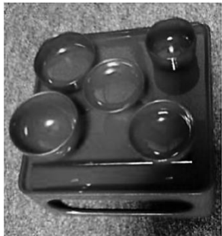
（写真1）浄土宗法事の供物

一方、神式の「祭」における供物は、「葬」の過程で行われる儀式〔表2〕を参照〕、つまり通夜祭か、あるいは出棺祭から供えるものと同じで、それは一般的に米・塩・酒・餅・果物・鯛・野菜・乾物（昆布）である。