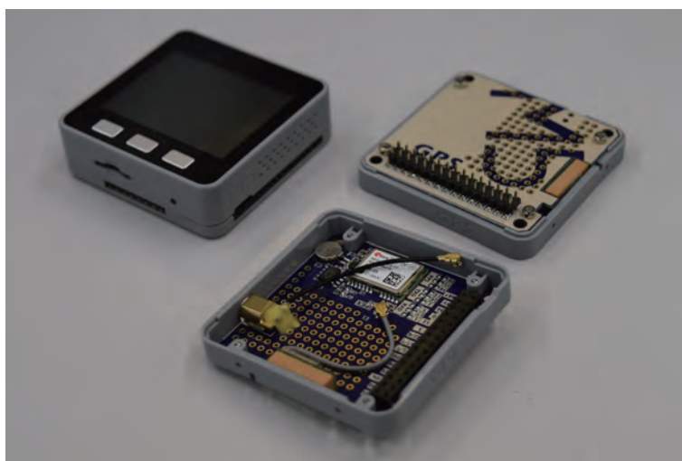
図 1: M5Stack Gray マイクロコントローラおよび M5Stack 用 GPS ユニット (表・裏)