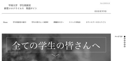
図1 特設サイトのフロントページ

また、教職員に関しては、コロナ禍において不慣れな遠隔授業をしたり、制限がある中で業務に携わらなければならなかった。そのため、学生同様、教職員のためのストレスへの対処法や、遠隔授業下において学生と関わる際の留意点や、障害のある学生への支援に関するコンテンツを発信した。