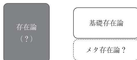
図2 「基礎存在論」と「メタ存在論」?

以上の議論は明晰であるように見えるが、ところで、そのなかで表立って言及されずにスルーされているものがなかっただろうか。すなわち、——もともと伝統的な形而上学において「神学」と二重性をなしていたという《存在論》のほうは、どうなったのだろうか? その《存在論》については、ほとんど何も触れられていない。