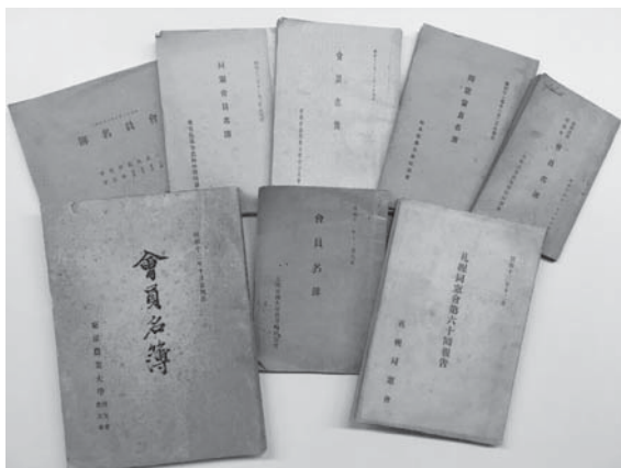
写真 1 各教育機関の同窓会名簿