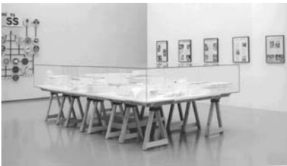
図6 《エデュケーショナル・コンプレックス》〈ユーロピオ的なアート・コンプレックスに向けて展〉 1995年の展示風景

ケリーはこうした偽りの記憶症候群を通して、自伝的な芸術・文化の体験の歴史に関する探求を進めていく。その試みの中心には、《エデュケーショナル・コンプレックス》というインスタレーションがある(図6、図7)。ケリーは、これまで自分が過ごした建物についての記憶を思い起こしながらドローイングを行い、それをもとに建築物の模型を創り上げた(図8)。ケリーはここでも、生活環境を模型によって自由に再現する世界技法や、立体物を用いて塔や門を作るウッドチップの立体構成といったアートセラピーの方法を模倣しているように思われる 17) 。アイルランド系を出自とするケリーは、幼少期を過ごしたデトロイトの自分の住居やまわりの風景、幼稚園、工場、聖メアリー教会、ステイヴンソン小学校、ジョン・グレン高校、ミシガン州立大学のアン・アーバー校、カリフォルニア芸術大学など