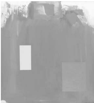
図13 ハンス・ホフマン《永遠の記憶》1962年 213.3×183.2cm ニューヨーク近代美術館

ケリーの《エデュケーショナル・コンプレックス》の試みは、ハリウッドと結びついた映画産業だけでなく、芸術教育にも結びつけられている。先に述べたように、自分自身の抑圧者の名前としてハンス・ホフマンという芸術家・教育者の名前が示唆されていた。アメリカにおける芸術のモダニズムの歴史において周知のことであるが、二〇世紀初頭のパリでピカソやマティスによる芸術動向に影響を受けたホフマンは、大戦中に戦禍の難を逃れて、アメリカで芸術教育の活動を行い、後に抽象表現