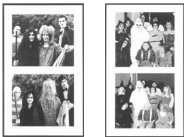
図10 新聞写真をもとにしたステージド・フォト グラフ2004-05年 ラグ紙の上のカラー 写真と白黒のピエゾ印刷

ともに、三十のスクリー ンのあるインスタレー ションとして展示した (図11)(20)。ヴィデオ 作品は、『エデュケー ショナル・コンプレッ クス』のモデルとなっ た近代的で合理主義的 なモダンな学校の校舍 がロケーション地とな り、そこで教職員が働 いているだけでなく、悪魔やヴァンパイアなどに扮した登場人 物によって、テニスコートでは宣誓式が行われ、体育館や教室 や裏庭では様々なダンスやポップミュージックや宗教的儀式的 パロディを満載した奇妙で馬鹿馬鹿しい余興が披露される。賛 美歌とヒップホップ、スタンダップ・コメディと教室での討論 ゴスとヘビメタ、モダンダンスとダンスセラピー、パンクとカ ラオケ、秘跡とミスコン、ホラー映画と聖詩劇、ゴスペルとネ イティブの儀式、トレインダンスとホースダンスなどなど。モ ダニズムの純粹形式と学校での課外活動や教会での儀式は、T Vバラエティー番組『サタデー・ナイト・ライブ』や『オブラ ・ウィンフリー・ショー』やMTVを模倣しながら、カーニヴァ ルのに混淆されていく。これらの形象は、アカデミーという神 聖な空間に忍び込む、禍々しい商業主義の「悪魔」の形象の一 覧表になる。それらは、精神分析的な置き換えの技法によって 提示され、奇妙で歪んでいるがカリカチュアとなった回復記憶 のイメージとして再現されるのである(MHP74-291)。 さらにケリーはこれらの形象たちが纏うシンボルであるバッ ジやペンダントを収集して、美術館の貨幣のコレクションのよ うに陳列棚に並べる(図12)。それらの配置は、形態的な類似 性に従い、微妙な歪みをもたせて形態変化(morphology)を 繰り広げるように集められている。シンボルの形態は、十字架 五芒星やひとで、ハロウインのカボチャ、太陽神や悪魔、そし