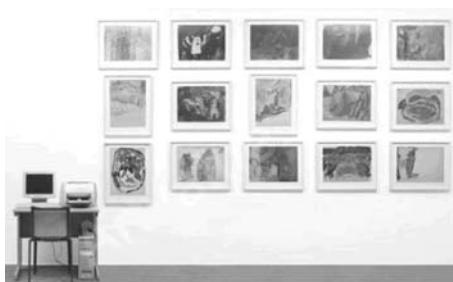
図3 ケリー《我々は前言語的なものとともに廃棄することを通してのみコミュニケーションする》1995年 それぞれ61×73.6cm

この時期からケリーは、個人史を芸術作品の発表を通して分析的に回想する作業を行ないはじめるが、その作業にはアートセラピーの方法が明白に念頭に置かれている。《我々は前言語的なものとともに廃棄することを通してのみコミュニケーションする》(一九九五年、図3)と題されたインスタレーション作品でケリーは、一九七〇年代初頭に学生時代の芸術教育のなかで、児童に絵画を教えた経験を振りかえっている(MHE58)。ケリーは課外活動で、保育園や幼稚園の子どもたちの芸術教育のアシスタントをしており、その時期に子どもたちが描いた作品を保存してあった。そのうち普通ではない表現が見られる作品十五点を選び、写真複製として展示し、それにアートセラピーの解