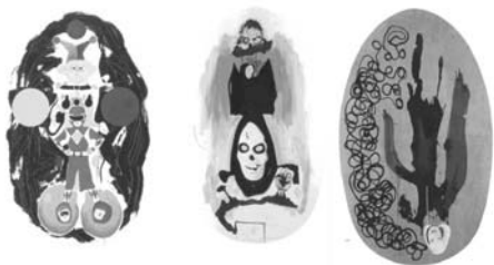
図15 《十三歳の季節》シリーズ1994年《新年の誕生》、《死》、《サボテンの花（中年期の紫のたそがれ）》木のの上にアクリル 158.7×101.6cm

《十三歳の季節》と題された作品はホフマンからの抑圧を告発すると同時に、彼に対するオマージュもがせめぎ合っている。ケリーは子供のためのおもちゃや商品や広告のイメージを、一九七〇年代に発案された心理学の評価技法であるマガジン・フォト・コラージュに仕上げたうえで（図14）、それらのコラージュを基に一枚のキャンバスに合成しながら、絵画として仕上げている（図15）。ケリーはこれらの形態や色彩のコンポジションをホフマンの造形理念に特徴的な「プッシュ・アンド・プル」（異なる平面を押し引きしてそのあいだの関係性から立体感を生み出す方法）の原則に即して仕上げていった。出来上がる絵画は、アウトサイダー・アートにも似ているが、抽象表現主義、ポップアートが合