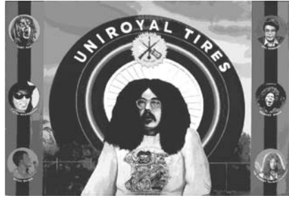
図16 マイク・ケリー《ホワイトパンサー党のジョン・シンクレアとデトロイト・ロック・シーンの人物たち》2001年 シカゴ美術館蔵 左上からイギー・ポップ ミッチ・ライダー テッド・ニーゼント 右上からローカルTV の司会ビル・ケネディ マゴット・ブレイン クエスチョン・マーク&ミステリアンズ

買うパフォーマンスを行い、大学教育で抑圧されてきた感情を露わにした 28 。一九七〇年代末にはカウンター・カルチャーも、当初の理想を急速に失い、抑圧を再生産する側にまわっていたことも事実である 29 。ケリーはバンド活動からは一旦離れカリフォルニア芸術大学で現代アートを学び、創作活動の核としていく。