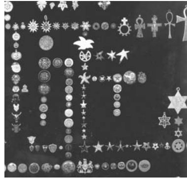
図12 《ありふれた装飾モチーフの終わりなきモーフイング・フロー（宝石ケース）》細部 ミックス・メディア 86.3×248.9×127cm

てダビデの星など千変万化に富んでいる。しかも、それらはジュエリーケースの平面に迷路のように配列されるが、キラキラ輝いて形態が変化する装飾の列には、生物の多様性を模