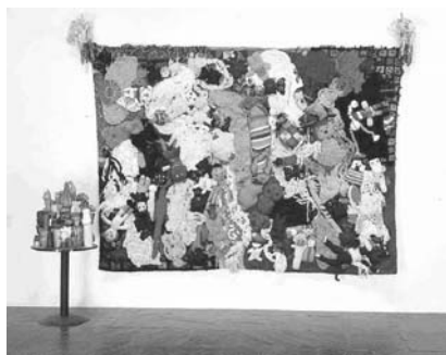
図1 マイク・ケリー《修復されるよりもたくさんさんの愛の時間と罪の報い》1987年 228.6×302.9×12.7cm ホイットニー美術館

マイク・ケリーの一九九〇年代半ばのインスタレーションも、こうした芸術と批評の潮流のなかで理解されている。ケリーは、この時期、ぬいぐるみを使ったインスタレーションをさまざまに行なっていた(図1)(そのオブジェのひとつが人気音楽グループ「ソニック・ユース」のCDジャケットに用いられ、ケリーの作品は広く知られた)。ケリーが説明するには、この動物のぬいぐるみの彫刻は、彼の作品の意図とは別に、子供に対する大人の振る舞いを表すと理解され、ぬいぐるみは虐待児を象徴しているとされたのだという。