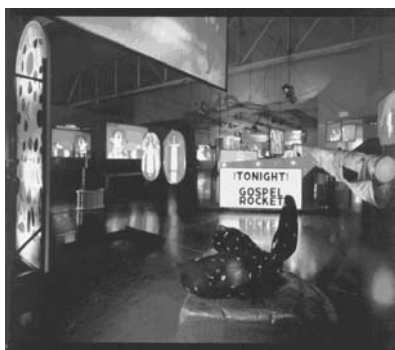
図11 《課外授業・投影法による再現》#2-35, 2005年 ガゴシアン・ギャラリーでの展示風景

ともに、三十のスクリー ンのあるインスタレー ションとして展示した (図11)(20)。ヴィデオ 作品は、『エデュケー ショナル・コンプレッ クス』のモデルとなっ た近代的で合理主義的 なモダンな学校の校舍 がロケーション地とな り、そこで教職員が働