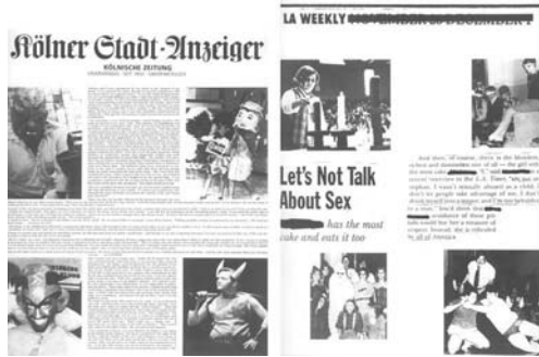
図9 《タイムレス/作者なし》1994年

それにもつわる悪魔儀式を先取りしたイメージのように思えないでもないが、これらの仮装パーティーや催し物の参加者全員を犯罪者の集団だと考える者は誰もいないだろう。単に一九八〇年代以前に悪魔の形象が学校で演じられていたというローカルな歴史的事実を証言しているに過ぎない。それは大文字の歴史とは関係なく、トリビアルな日常の小さな物語に過ぎない。だが、こうした写真を、事後的に振り返るならば何か犯罪写真のような禍々しい雰囲気も漂っており、悪魔儀式と関連付けてみたい誘惑にも駆られてしまう。というのも、大学のパーティー