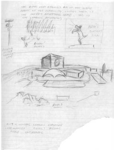
図8 《エデュケーショナル・コンプレックス》素描