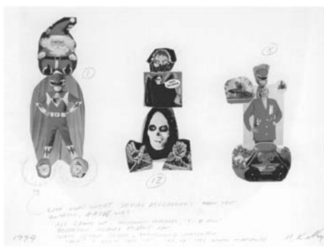
図14 マイク・ケリー「《十三歳の季節》のためのマガジン・フォト・コラージュ」

ろう。その教育理念自体に亡命者たちの失敗と迫害の経験が背負されている。それゆえ《エデュケーション・コンプレックス》で再現されるモダンで合理的な建物は、幼児期の表現欲動が芸術教育によって抑圧された場でもあると同時に、その欲動が書きかえられる