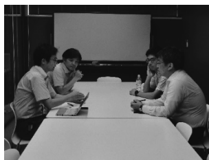
図 4.3 座談会

交流会終了後は、実際に先生方のアウトリーチ活動についての座談会を行わせていただいた(図 4.3)。今回は研究室の対外的な窓口となるホームページ作成について議論を交わした。研究室ホームページの充実は重要であるものの、その担い手は所属学生や共同研究者でウェブ作成に詳しい者に限られてしまうため、年ごとの