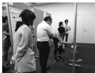
図 4.5 ポスター発表会

講演の合間には、FIRST 学部 4 年生・大学院生の他、知能情報学部、東京農工大学の学生達が自分たちの研究成果を発表しあうポスター発表会を行い、活発な意見交換を行っていただいた。その際、本テーマ関連の発表も 2 件行い、実際のアウトリーチ活動を行った（図 4.5）。