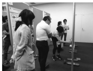
図 4.5 ポスター発表会

講演の合間には、FIRST 学部 4 年生・大学院生の他、知能情報学部、東京農工大学の学生達が自分たちの研究成果を発表しあうポスター発表会を行い、活発な意見交換を行っていただいた。その際、本テーマ関連の発表も 2 件行い、実際のアウトリーチ活動を行った（図 4.5）。