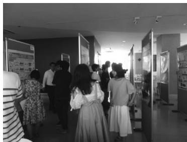
図 4.2 ポスター発表会

講演の合間には、FIRST 学部 4 年生・大学院生の他、知能情報学部、東京農工大学の学生達が自分たちの研究成果を発表しあうポスター発表会を行い、活発な意見交換を行っていただき、今後のテーマ遂行のヒントとなるトピックス、シーズの探索調査をその際に行わせていただいた(図 4.2)。