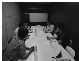
図 4.6 座談会

交流会終了後は、2018 年度に引き続き、実際に先生方のアウトリーチ活動についての座談会を行わせていただいた。龍谷大富崎先生も加わり、今回は本交流会の評価を行っていただいた。このような比較的小規模で密に、多岐にわたる学際的な交流会は類を見ず、今後も続けていければ面白いという意見や、ここからさらに共同研究が発展していければという意見、様々な分野の研究者と