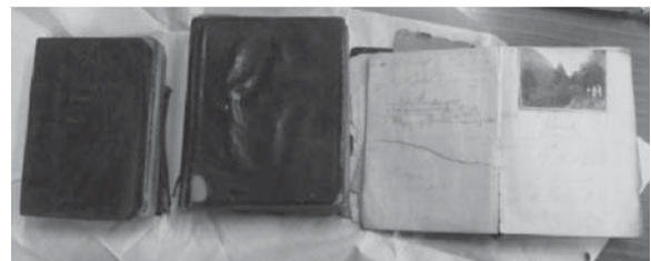
図4 善太郎茶屋に残された3冊の外国人記録簿 [大正12年より大正15年]

会員同士が交流する場所として、会議を開催し登山活動や徒歩会活動の記録をとどめていた茶屋、休憩所の存在は重要である。再度山には藤の棚茶屋、善之助茶屋、善太郎茶屋、摩耶山には行者茶屋、鷹取山にはつるや茶屋、塩見茶屋、布引には櫻茶屋などがあった。神戸徒歩会と縁が深かったのは、善太郎茶屋である。そこに残された記録簿は皮で装幀されていて、登山記