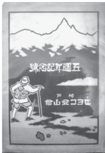
図7 『神戸ヒヨコ登山會 5周年記念号』表紙

神戸ヒヨコ登山會の活動内容もまた、会則に忠実に反映されている。「本會は會員相互の体育奨励を主とし常に山野を跋涉し名勝旧跡を尋ね神社仏閣に参拝以て身体を練磨し精神の修養を図ることを目的とす」（第3条）とあるように、身体と精神の修行こそが一大目的であった。そのため、第5条には連続の歩行を推奨する規定が定められる。「本會は登山奨励の爲め、（イ）一箇年間に四百回以上（ロ）同 三百回以上（ハ）同 二百五十回以上（ニ）同 二百回以上（ホ）三箇年に九百回以上別に規定あり各記念章を贈呈す。但し採点は入会日より起算す」とあり、年間を通じて日に複数回も登山することを求めている。