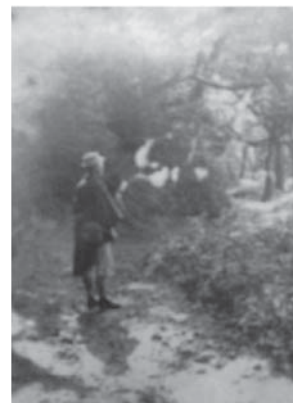
図2 六甲山の散策者（着物姿に皮靴を着用） （善太郎茶屋の『外国人記録簿』）