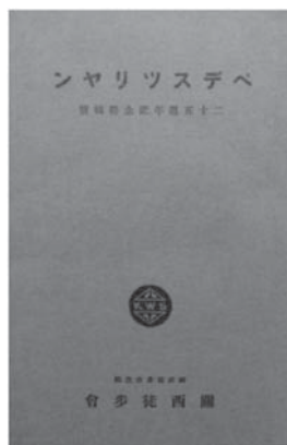
図8 『ベダスツリヤン 25周年特集記念号』表紙

会員数の急速な伸びは、1年目には190名、2年目は460名、3年目は715名、4年目は980名、5年目は1275名となり、5年間で6.7倍もの伸び率となって表れている。そしてこうした会員数の増加は、「近頃都人が保健衛生の道に追々知識が発達し、心身の鍛錬には大自然に親しむことの最も有効なるに醒めて、登山熱の益々向上は誠に時代の要求であり又甚だ喜ばしきことであります。思うに今や都人の過半は文明と云う病原により神経衰弱を初め種々の疾病に罹り乃至はこれが為の一つこそなき大切な命さえも捨てた人は決して少なくないのであります」といった危機感が裏には