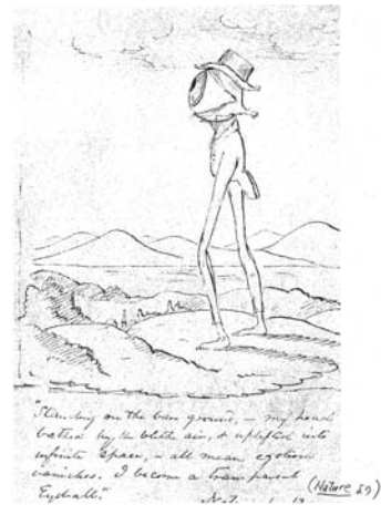
図11 エマソンを描いた戯画「透明な眼球」

エマソンは忠実に自然を描きなぞらえようとした作家ではなかった。自然を賛美することでは人後に落ちなかったが、自然そのものを愛でるような作家ではない。宇宙や自己を凝視するための媒体として自然に対峙したのである。むしろ自然に隠された自然（本性）を求めたのであった。エマソンの自然はきわめて観念化された自然ゆえ、自然などどこにも見えていないという逆説さえ生じてくる。こうしたエマソンの観念化された視線を図像化した、きわめて示唆的な戯画がある。エマソン自身が森のなかで、透明な眼球となり、自然と対峙しているうちに神秘的合一を果たし、「私」は無化してしまい、あるべき普遍的存在、事物の本性を見出していくのである。きわめて意識化されたこうした「神秘的関係」こそ、永堯が希求したものであった。