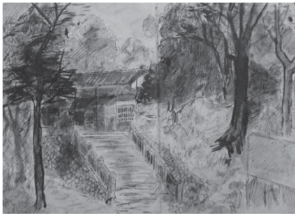
図3 再度山の山門（善太郎茶屋の外国人記録簿に描かれた水彩画）

塚本永堯は外国人たちが六甲山上で路をつくる犠牲的な精神に感激し、自らも道路の造営に参画したいと願った、と言う。そもそも道をつくるのは人間の原初からの根源的な営みである。そうした営為に永堯たちを駆り立てた一端は、道そのものの本質にあるのではなからうか。道は居住の場ではないが、すべての人々が共有する場所であり、とどまることなく、どこへでも通じている。そして空間としての道は過去と同時に未来へものびていく。何も存在しない路面を凝視していると形なき可能性があるように思えてくる不思議な場である。文学作品において道が人生の比喩になるのも実に自然なことである。若き日の永堯たちは、六甲山の路なき道に自らを映していたのではあるまいか、まさに救道の道として――。