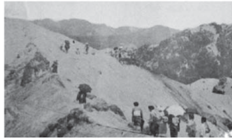
図6 着物姿で六甲山に行く日本婦人アルカウ會 (『山岳美』)

ただ歩行会がもつジェンダー性を考えるとき、「日本唯一の婦人登山旅行の會」である「日本婦人アルカウ會」はきわめて興味深い対象となる。まずは他の会と著しく異なるのは、入会資格が厳しく問われる点であろう——「一度臨時に参加せられたる後、會員の紹介にて申込書を送り入會を許さる一般婦人の臨時参加