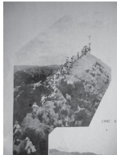
図5 日本アルカウ會の六甲山縦走(『山岳美』)

こうした林立する徒歩会のなかで、「日本アルカウ會」は、「剛健質素、天下の覇者」と誇らしげに自称するように、「古き歴史と実力とを有せる」、まさに神戸にある徒歩会の代表のひとつともいえる存在であった。「吾日本アルカウ會は、尚幾多の抱負を持つ。やがてこれを実現するや、ことごとく天下の模範となる筈である。會とか團とか相片寄らずして渾然として各同趣味者と協力して事業を進めたい。これ吾党の念願である」と理想を高らかに宣言している。「天下の模範」などという独りよがりな文言が気になるのだが、