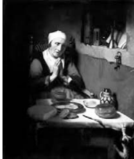
▲「祈る老婦人」134×114センチ アムステルダム国立美術館蔵

のかに感謝するという行為が含まれている。この絵には夕食を前に一心に祈る老婦人が描かれている。1人暮らしの食卓には、パンのほか、鮭の切り身、チーズ、バター、ソースの壺