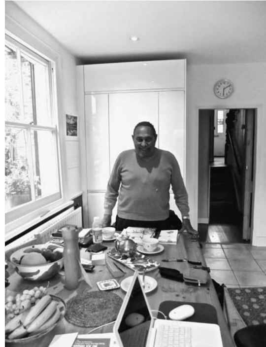
写真1 Stuart Hall, July 16, 2011

2011年7月、私は再びロンドンへ行き、スチュアート・ホールを訪ねた。入院前であると聞いていた。話