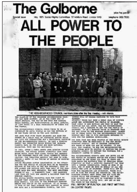
図3 The Golborne, May, 1971