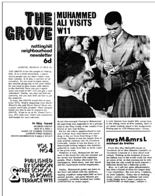
図4 The Grove, May 23, 1966