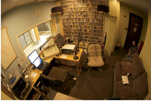
写真1：WRFU スタジオ，2012年8月